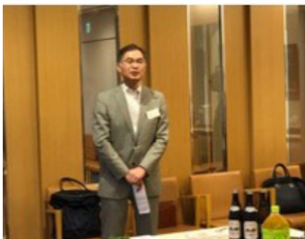
栗飯原新会長挨拶