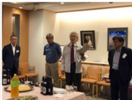
来賓:築理会大岩会長挨拶