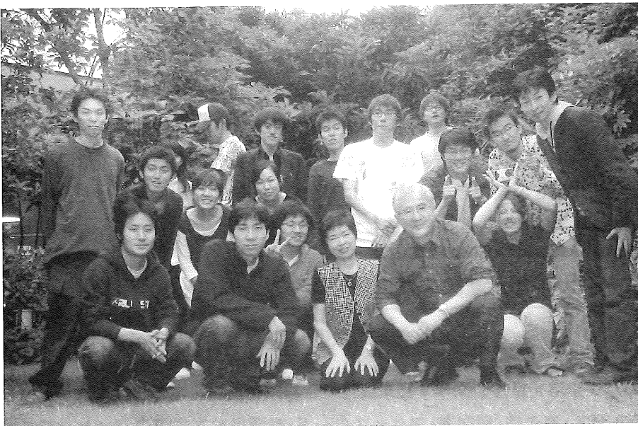
(渡辺研究室 バーベキュー・パーティ 拙宅にて、2004年5月24日)

1961年東京大学建築学科卒業。プエルトリコ政府勤務を経て、1964年ハーバード大学大学院修士課程修了。1965年東京大学助手。シェフィールド大学客員助教授及びカリフォルニア大学客員研究員を経て、1978年より建設省建築研究所室長・部長等を歴任。1990年より現職。ミシガン州立大学・ワシントン大学で客員教授。都市計画学会論文賞・同国際交流賞、建築学会賞、土木学会出版文化賞、不動産学会論文賞など受賞。主な著書等は『アメリカ都市計画とコミュニティ理念』『比較都市計画序説』『都市計画』の誕生』『市民参加のまちづくり』『市民版まちづくりプラン実践ガイド』