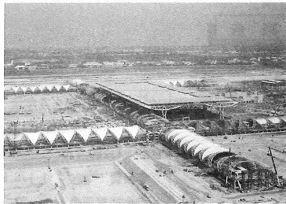
メインターミナルビルとコンコースビルの全景(2004年8月20日)